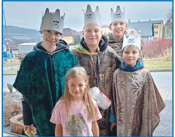
V Koutě na Šumavě se konala Tříkrálová sbírka pod záštitou České katolické charity 5. až 9. ledna. Ke koledování se připojila také obec Spáňov a obec Oprechtice. V Koutě na Šumavě se vybralo 64 696 korun. Děkujeme! Obec Kout na Šumavě