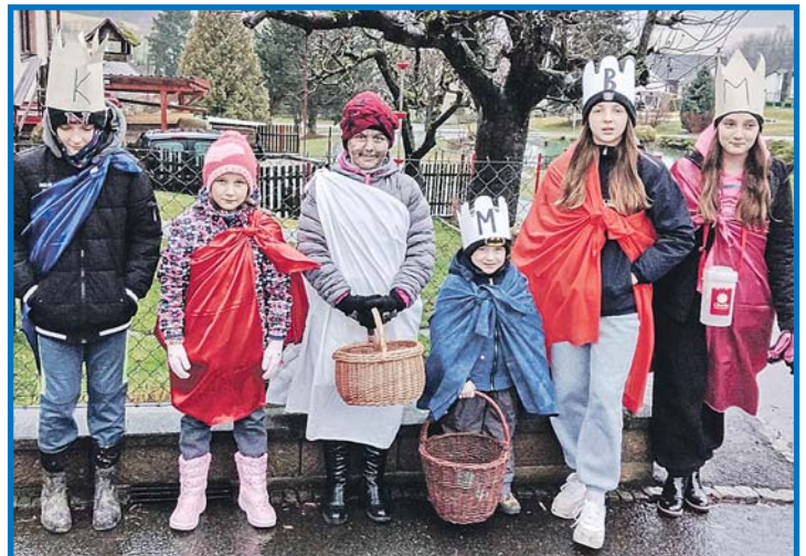
Hned 4. ledna uspořádali v Loučimi Tříkrálovou sbírku a v deštivém počasí sešlo se dětí jen šest, takže tak tak mohly obejít obec na dvě party. Přesto se podařilo vybrat celkem 5 365,- Kč. O 125 korun více pak vybrali Tři králové ve stejně početném Libkově. Z. Huspek