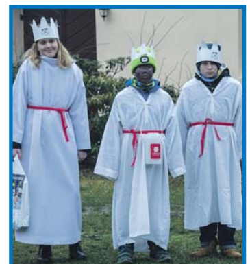
Také v Nové Vsi (zleva) a v Kolovci proběhla každoroční Tříkrálová sbírka. (šk, pd)