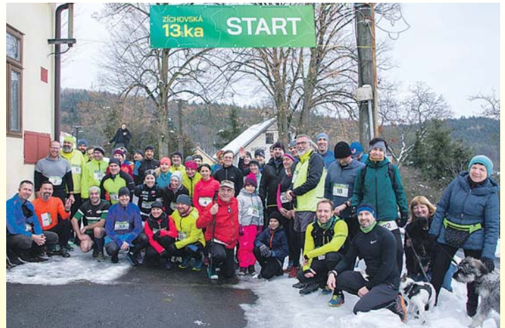
V sobotu 9. prosince startoval další ročník Zíchovské třináctky = třináctikilometrový přespolní běh v okolí Zíchova a Kolovče po stezkách v okolních lesích. více str. 4