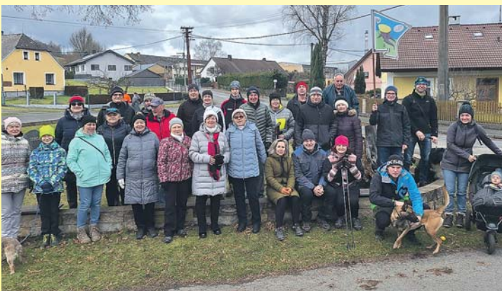
Start Novoročního pochodu Brnířov – Štefle. V cíli se sešlo 33 lidí a 3 psi. Více str. 2