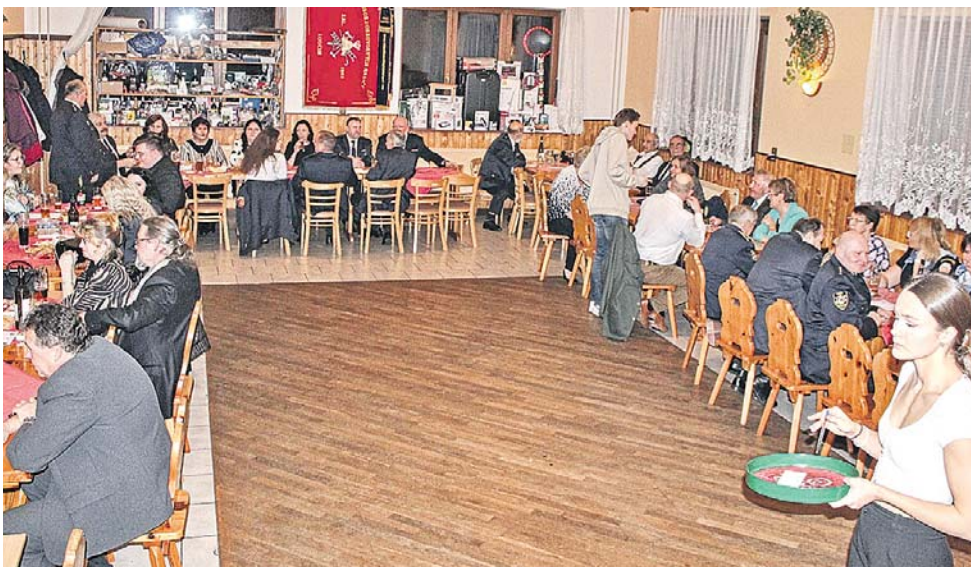
Pohled do sálu krátce po začátku bálu.