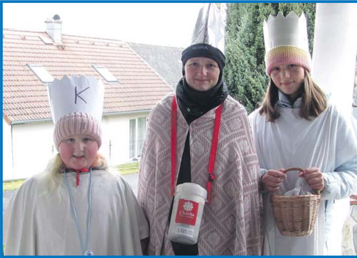
V Chodské Lhotě tři skupiny koledníků, 8 dětí a tři dospělí, vyšly v 10 hodin od Tvardíků a prošly Chodskou Lhotu, Výrov a Štefle. V Chodské Lhotě se vybralo 31 326,- Kč. M. Jäger, J. Nunvář